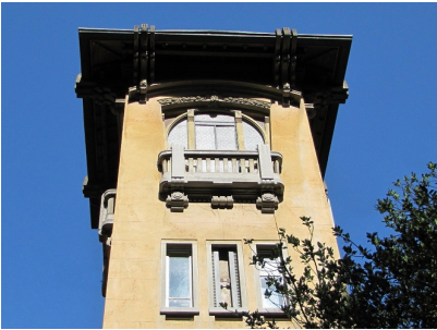
Particolare della torretta.