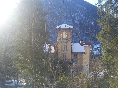
Villa Cesarina, vista est.