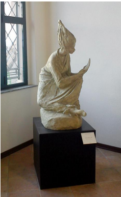
" Ninfa sapiente ", di Adriano Bozzolo, 1988.