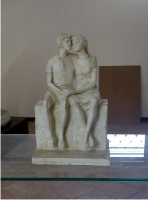
" Innamorati ad Alassio ", di Eros Pellini, 1978. Alassio (SV) . Bronzo è stata real