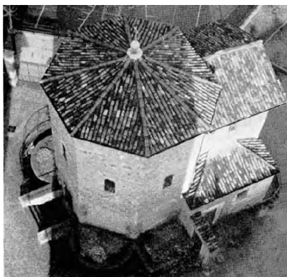
Vista aerea del battistero. Carta di Arcisate in Rivista della Società Storica Mazese , fasc. XIII, ap